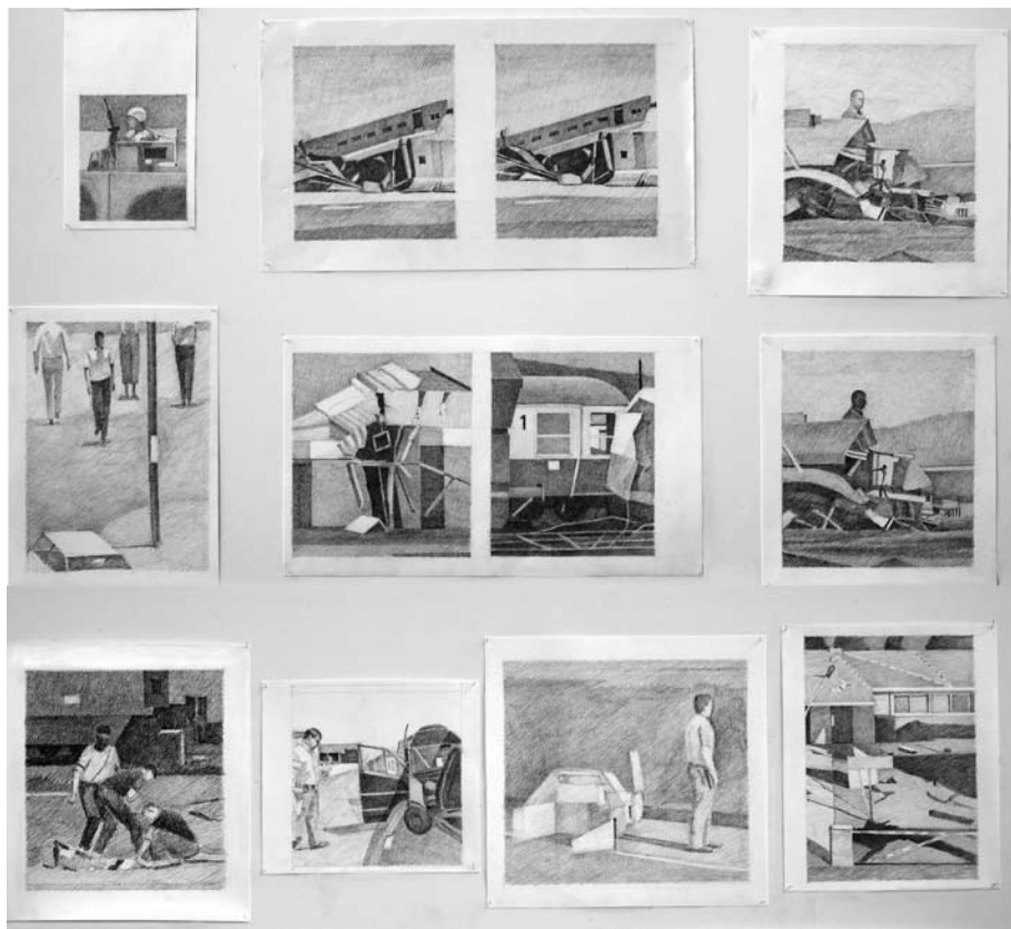
Utsnitt av vegg med tegninger