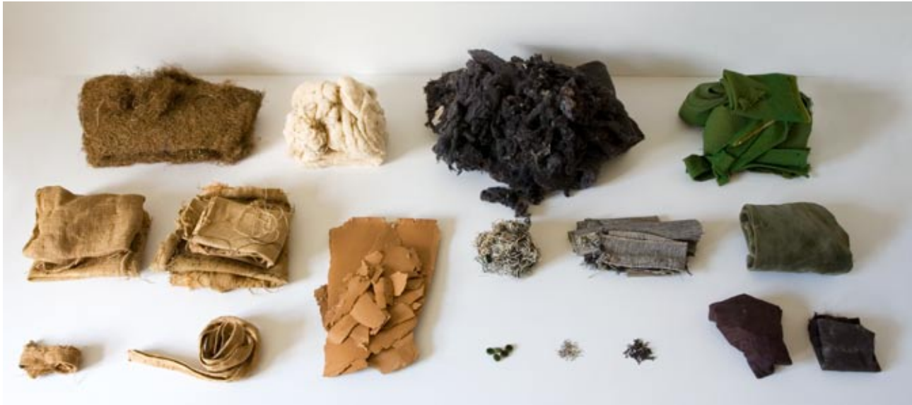
Fra "Obduksjon" 2008